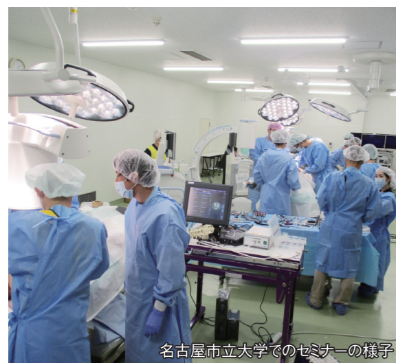
名古屋市立大学でのセミナーの様子

札幌と名古屋の講習を通して、キャダバートレーニングは海外と違い、特に営利目的ではないため、多くの方々の尽力があり、様々な制約を乗り越えて国民の健康、安全のために行われていることを実感しました。私なりの考えですが、手術手技のための解剖が、日本で根付かない理由は、日本人の宗教観にあると考えています。海外とは異なり、古くから日本人は死後もご遺体に魂が残ると考えると聞いたことがあるからです。特に、日本において系統解剖は可能ですが、キャダバートレーニングのためのご献体に抵抗があるのは、死去してから再度手術を受けることになるという印象を抱かれるからではないでしょうか。しかし、今回の実習で、ご献体者より、最新医療技術発展のためのご献体にご理解とご協力をいただけたのが、非常に安心して実習を行うことができました。ご献体いただく方のご厚意と解剖学教室の先生方のご協力、そしてご遺体固定法の進化により、日本において安心して手術手技の鍛錬をすることができます。この手術手技鍛錬のための解剖実習がさらに拡大し、日本で可能になることは我々医療従事者が、患者さんへ安全で適切な方法と手技を提供するためには必要なことであります。さらに我々は手術技術の修練に励み、国民に安全な医療を提供する義務があると考えます。